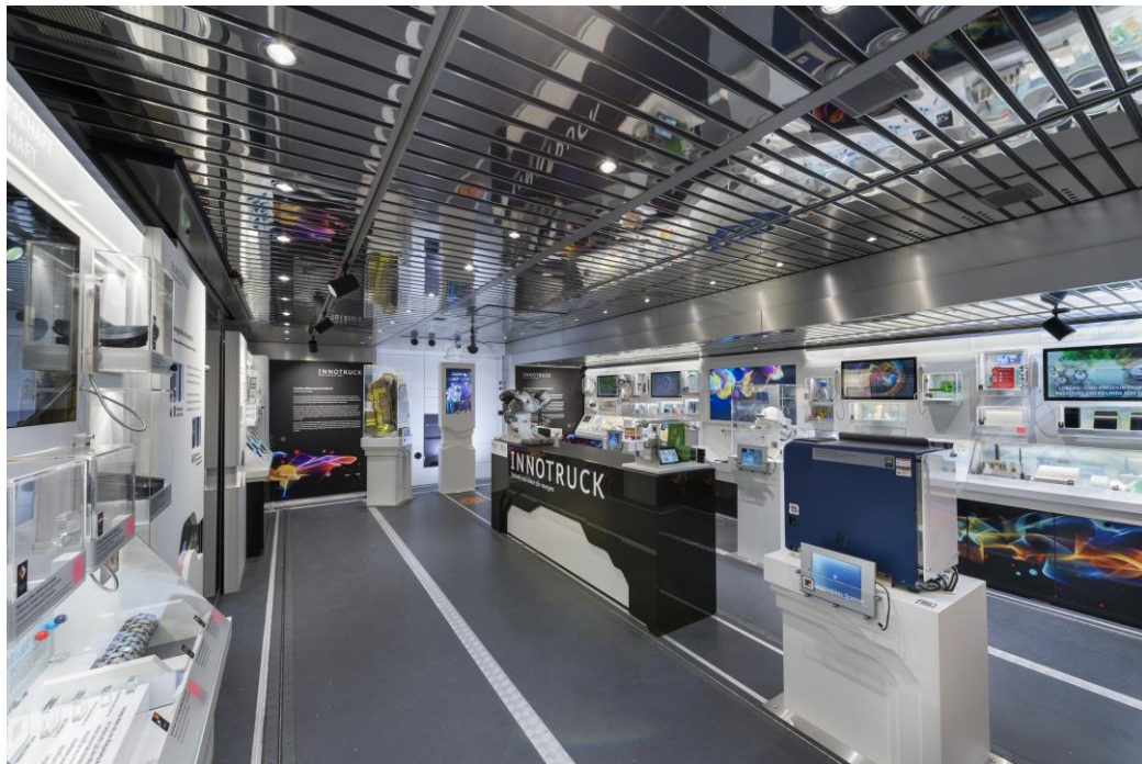
Bild 3: Der InnoTruck ist als „Innovationsbotschafter“ seit 2017 unterwegs in Deutschland.