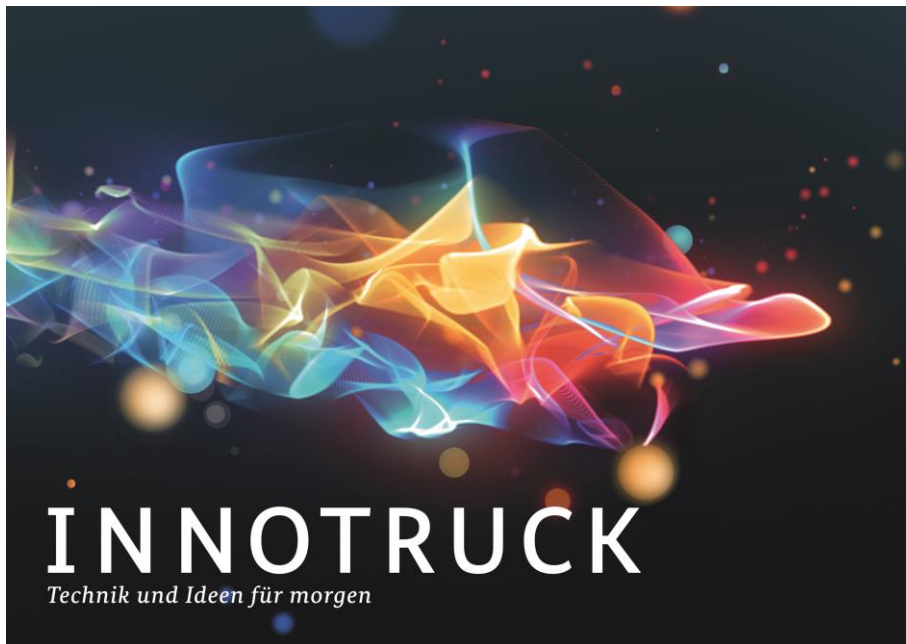
Bild 2: Bildmarke der Initiative ist der prägnante Innovationsstrom. Dieser zieht sich aufmerksamkeitsstark durch alle Kommunikationsmittel des InnoTrucks.